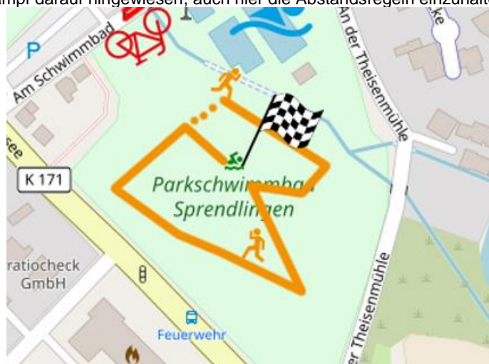
(Verlauf der Laufstrecke, innerhalb des Freibadgeländes)

Die Laufstrecke befindet sich auf der Liegewiese des Freibadgeländes (kein öffentlicher Raum). Die Teilnehmer werden vor dem Wettkampf darauf hingewiesen, auch hier die Abstandsregeln einzuhalten.